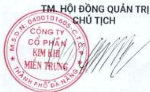
Huỳnh Trung Quang

Quy chế này gồm có 09 Điều, được đọc công khai trước phiên họp Đại hội đồng cổ đông thường niên ngày 17/4/2025 và có hiệu lực ngay sau khi được số cổ đông sở hữu trên 50% tổng số phiếu biểu quyết của tất cả các cổ đông dự họp tán thành./.